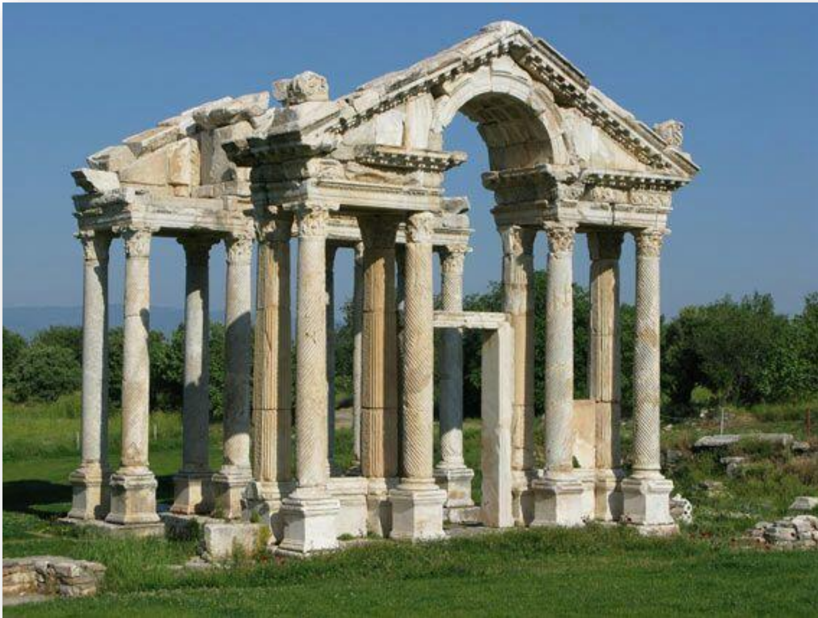
TEMPLO DE AFRODITA (La diosa de la belleza y el amor)